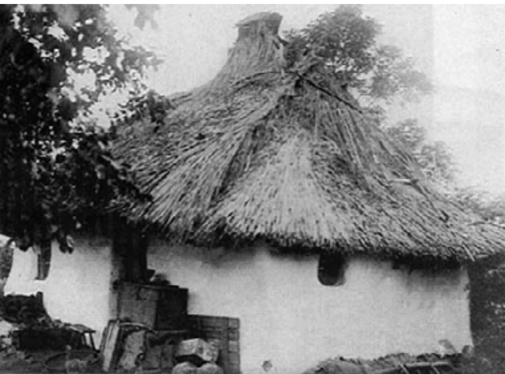
Kéthelyes, náddalfedett lakóház. Nagyrosvány (Borsod-Abaúj- Zemplén megye)

Ezt a több mint száz év előtti állapotot azonban alaposan megváltoztatta a vízszabályozás. A nagy „kerektó” alaposan összébb húzódott, szerényebb lett, s egynémely régi haltanyán ma acélos búza terem, vagy rosszabb esetben kitűnő káposzta. Vigyázni kell azonban az itt munkálkodó embernek. Ha rágyújt a pipára, el ne dobja a gyufát, vagy nyitva ne hagyja a kupakját, mert a föld meggyullad tőle. A Pallagcsa déli oldalán vagy egy hátrész, melyet úgy hívnak, hogy „Nagyégés”. Mikor ez égett, katonai segítséggel az egész Bodrogtó végéig a mentést és oltást. Nagyon veszedelmes a földégés. A lápos, tőzeges üledék az, ami meggyúl, s a tűz fél, vagy egész méter mélyre is befúrja magát (amilyen mély a tőzegréteg), sokszor észrevétlenül halad 50 métert is és ha ember vagy állat ilyenkor rálép az ilyen helyre, lesüllyed az égő zsarátnok-pokolba.